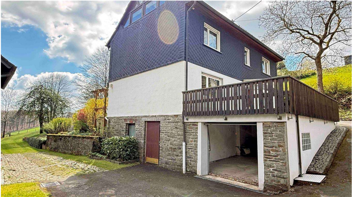
Wohnhaus mit Garage und Glasgiebel (siehe oben!)