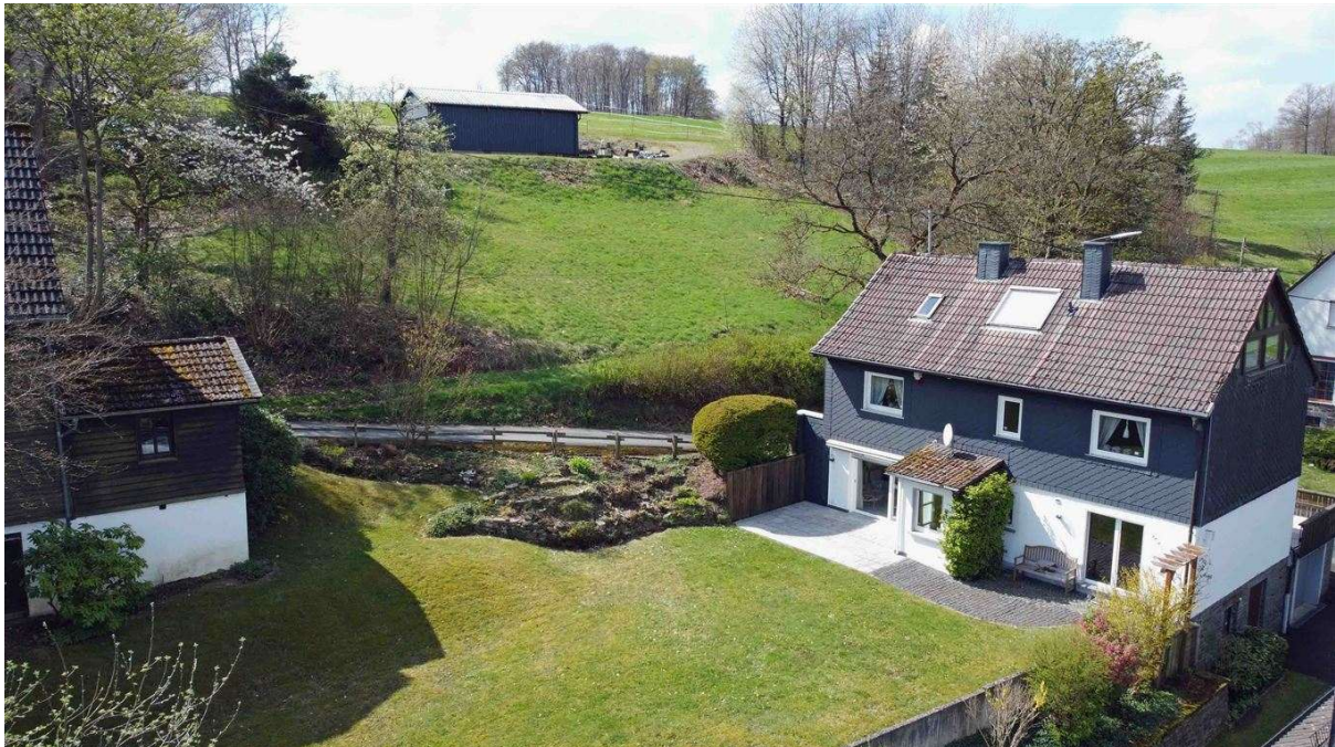
...der Rückseite, direkt am Wohnzimmer und Wohnküche