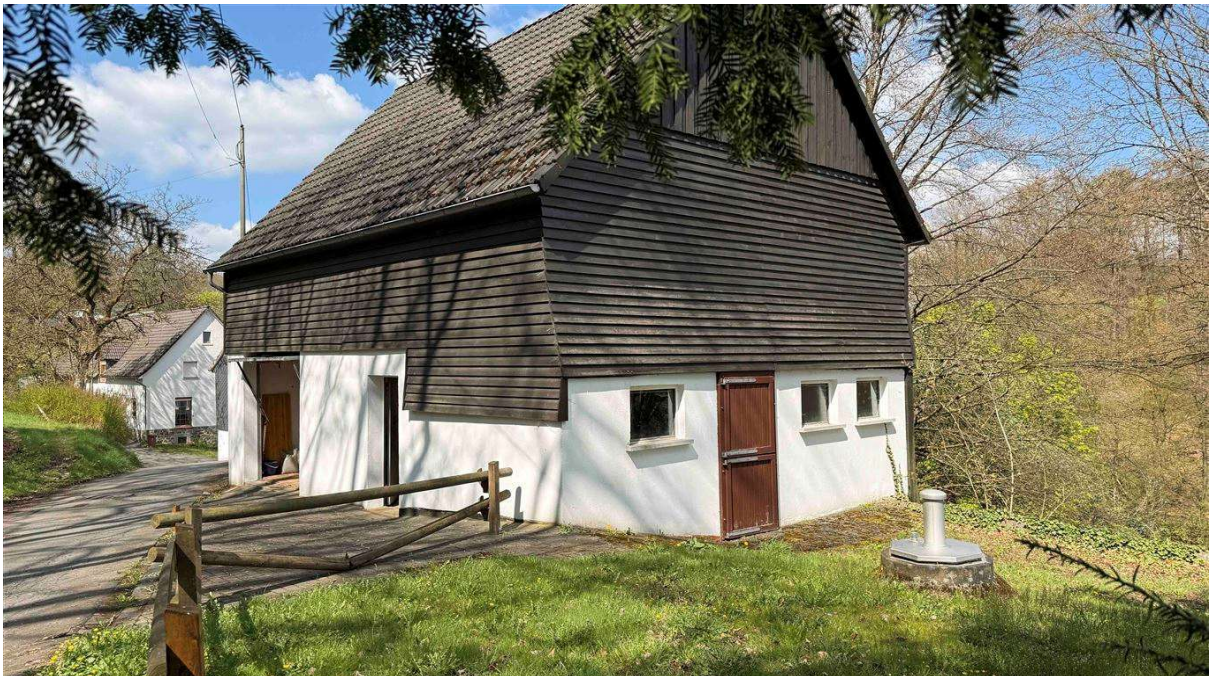
Nebengebäude/Ausbaureserve, - jetzt: große Garage