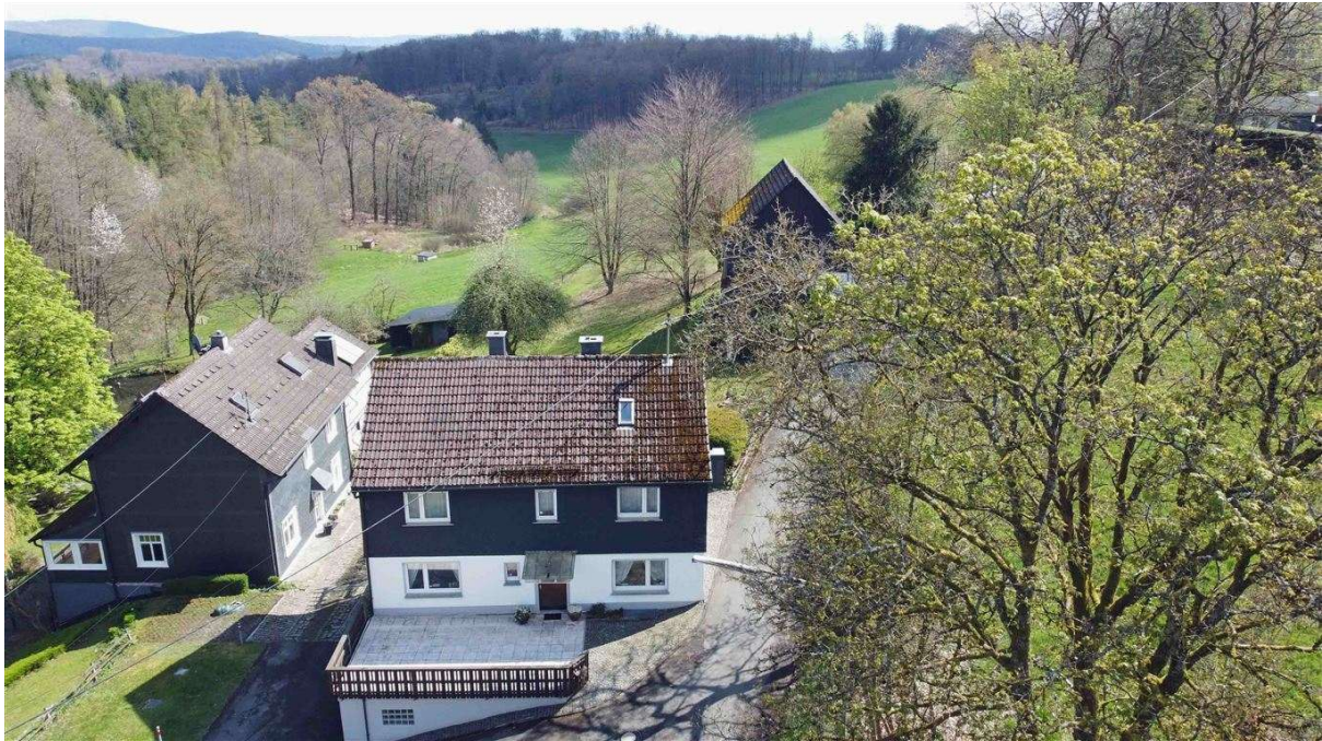
Echtes Refugium mit viel Ruhe und herrlicher Natur