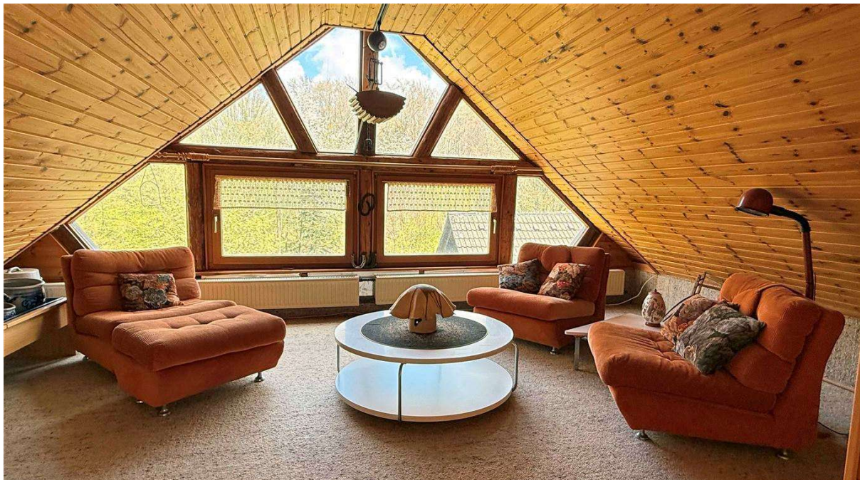
besonders gemütlich: Dachstudio (11 m x 5,40 m)