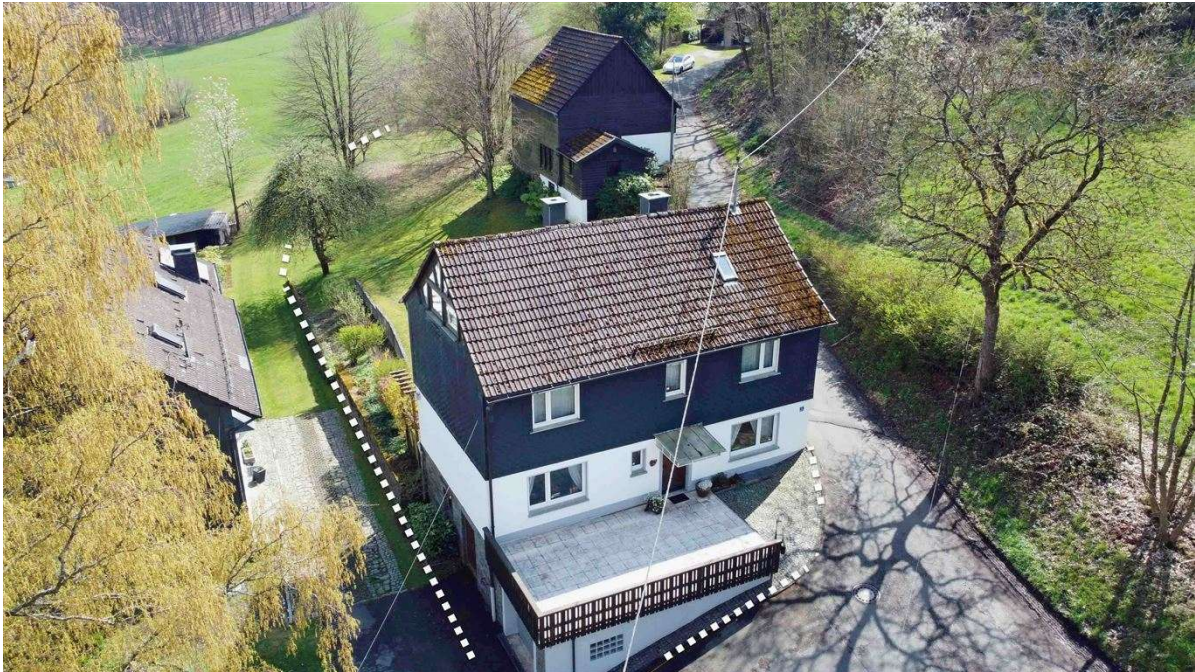
Terrasse an der Eingangsseite (Norden) und an...