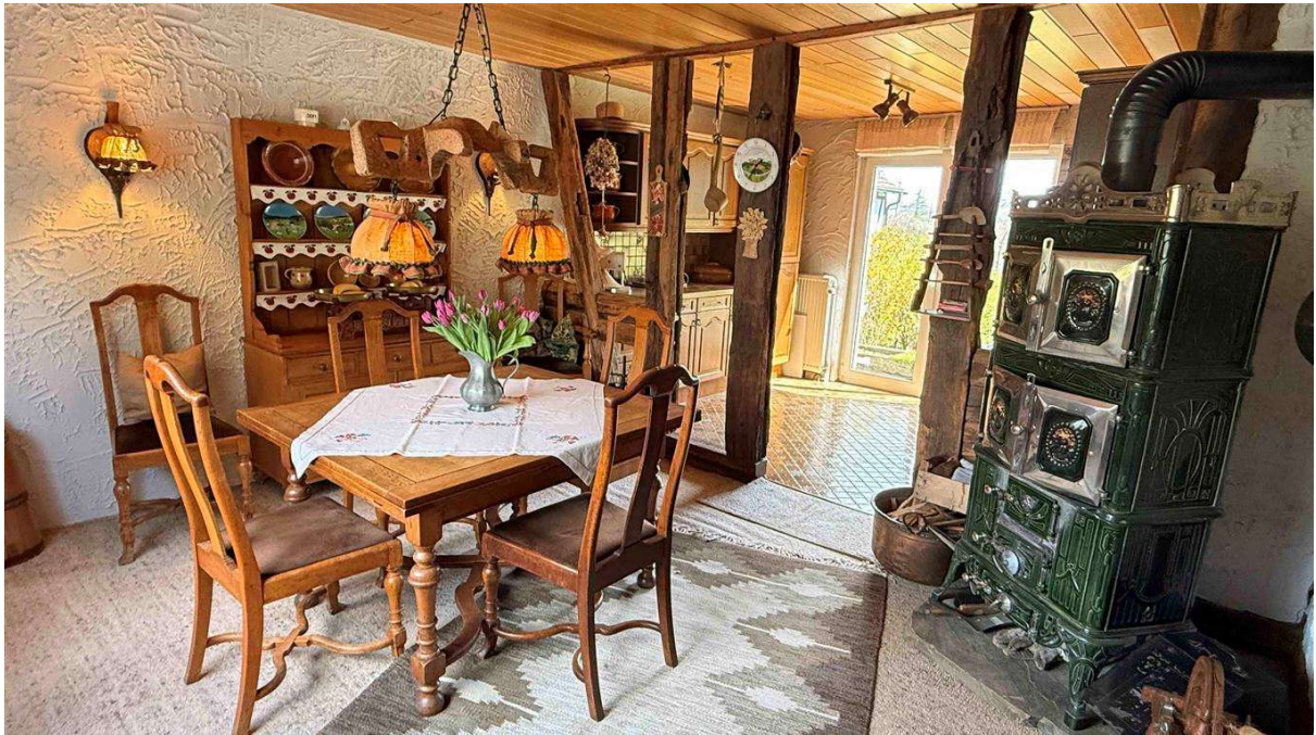
gemütliche Wohnküche mit herrlichem Ofen und...