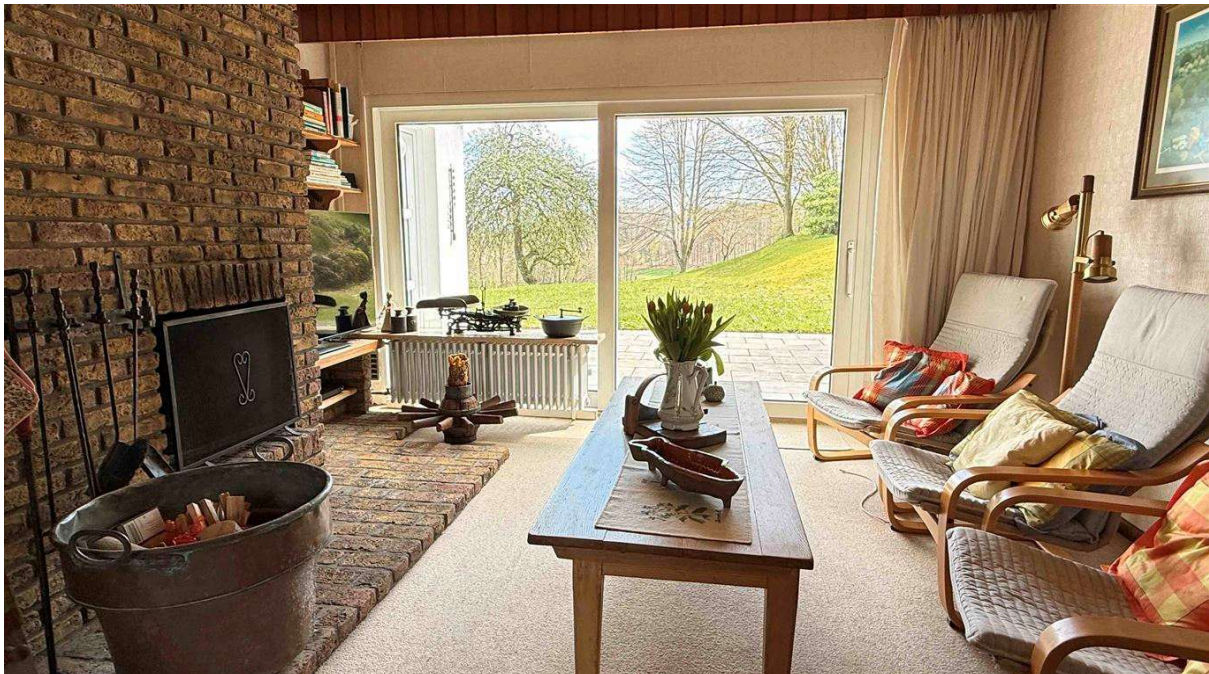
Wohnzimmer 25,7 m 2 mit offenem Kamin und Terrasse