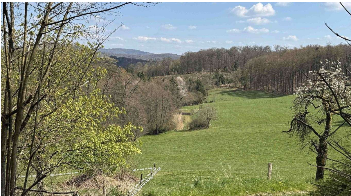
malerische Landschaft, direkt am Haus angrenzend