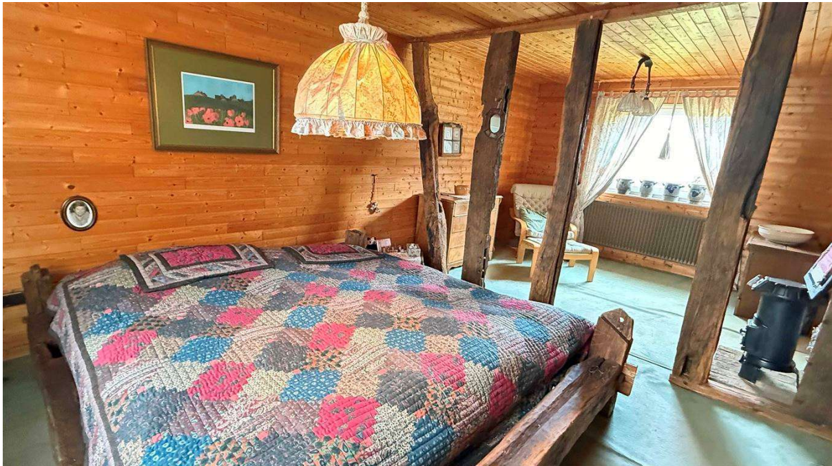
Eines der zwei Schlafzimmer im Obergeschoss (je 25 m 2 )