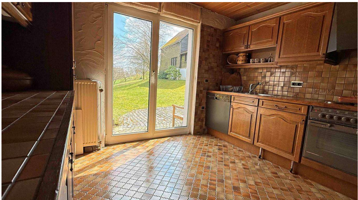
...Ausgang zum Garten / Terrasse