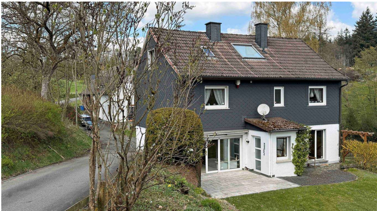
167 m 2 Wohnfläche auf drei Etagen und Keller