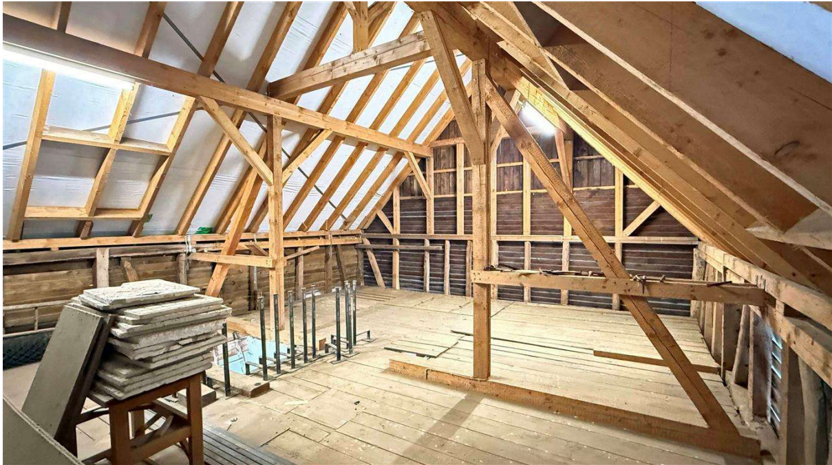
Ausbaureserve im Nebengebäude (7,5 x 9,5 m)