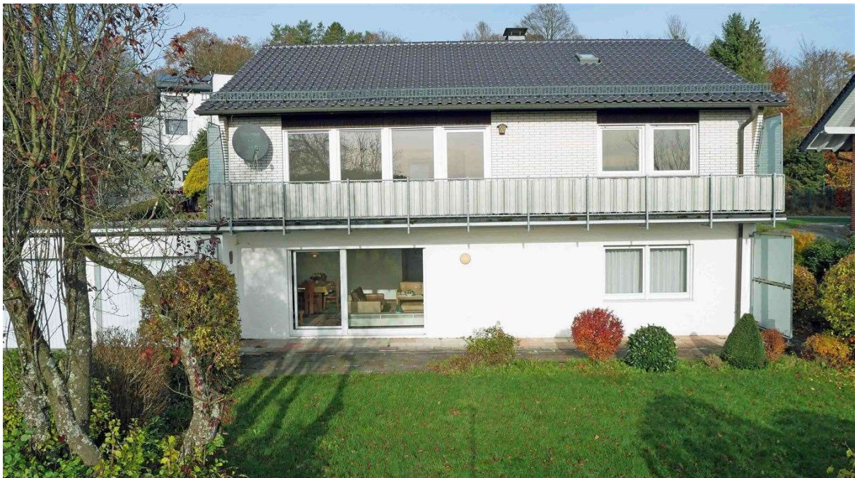
Rück-/ Sonnenseite mit Balkon, Terrasse und Garten