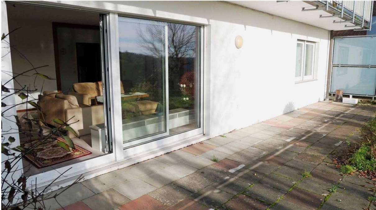
ebenfalls große Terrasse an der ELW im Souterrain