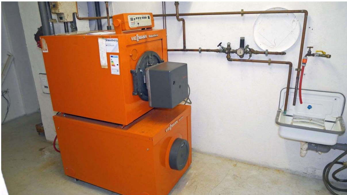
Öl-Zentralheizung Bj. 91 (modernisierungsbed.)