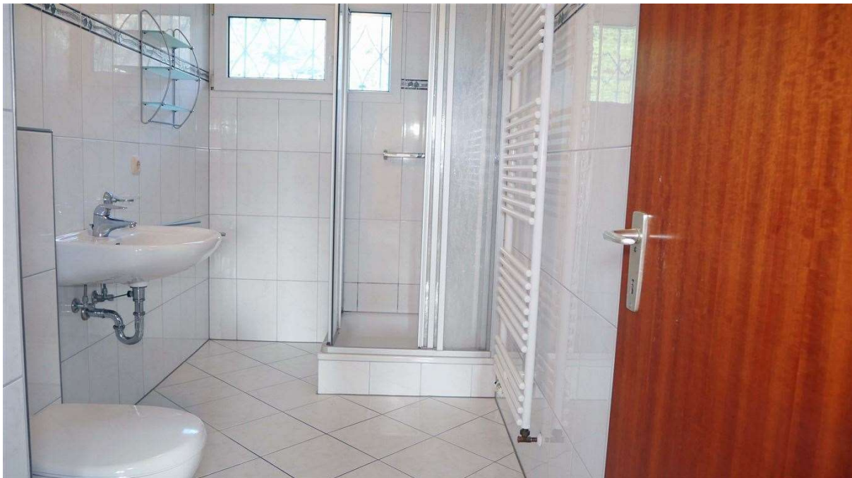
Bad im EG (2010 modernisiert)