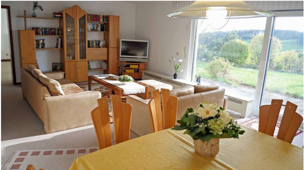
ELW: Wohn-/ Esszimmer 33 m 2 mit Schiebetür zur...