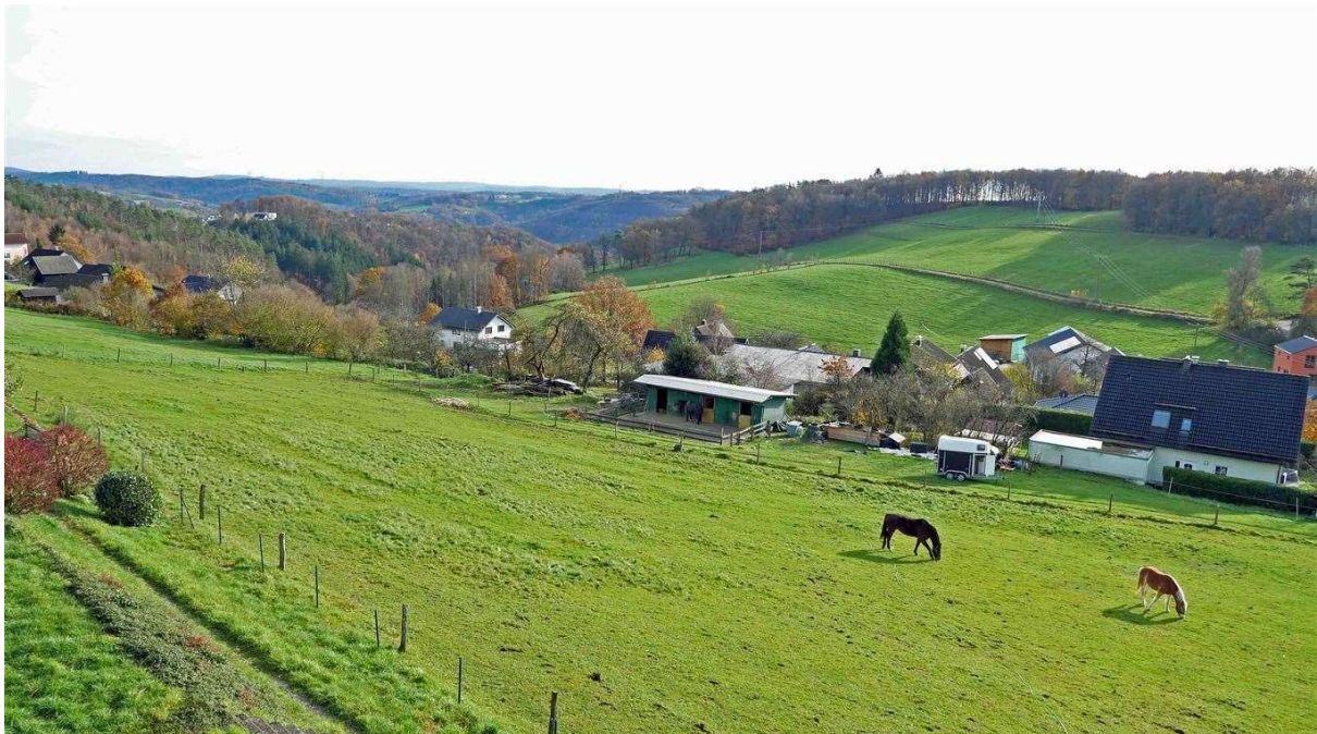
viel Ruhe und Natur