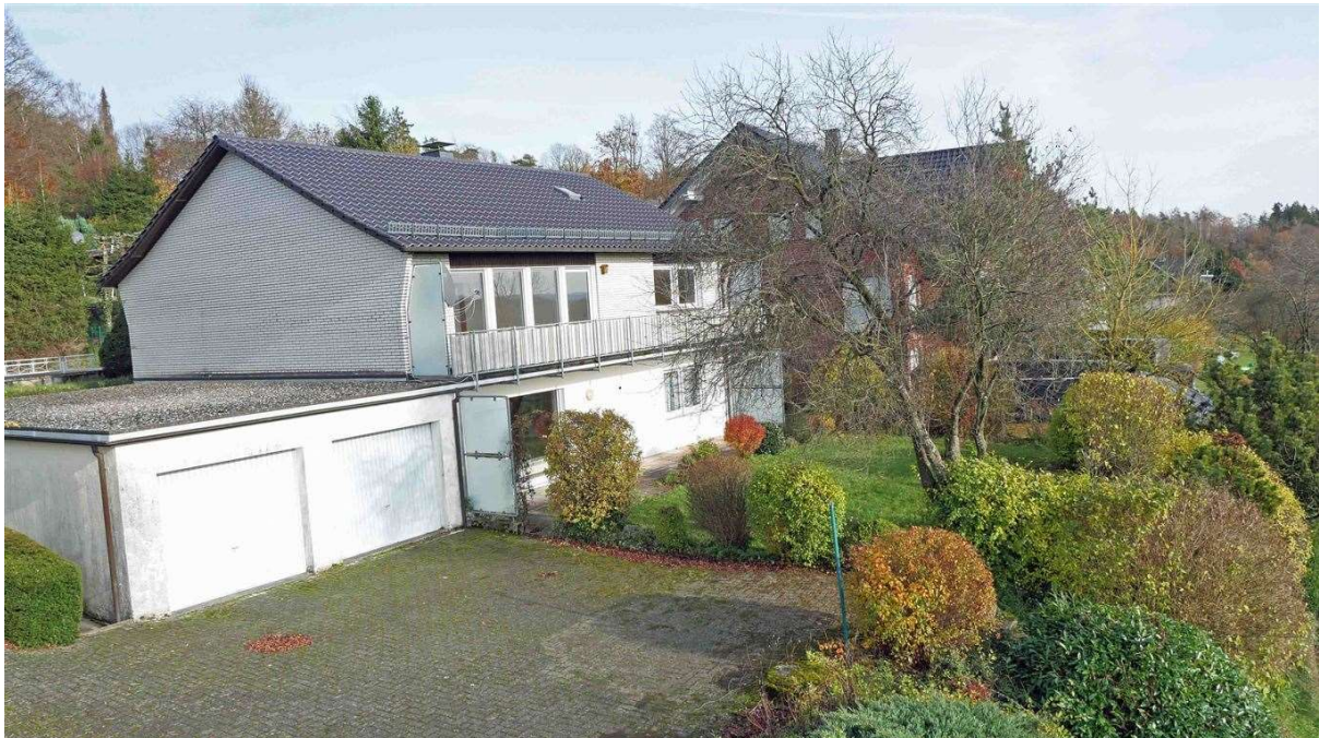
Rückseite mit Garagen, Garten