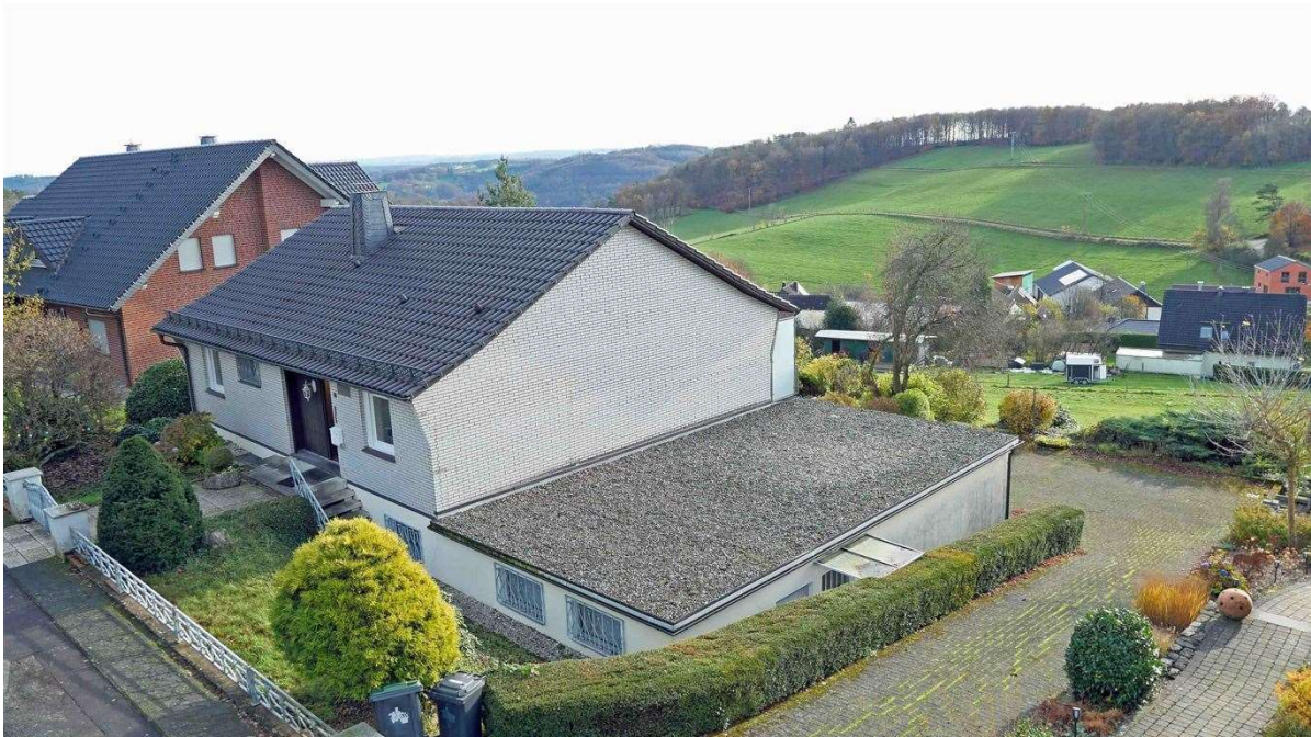
Das Garagendach wäre auch als Terrasse nutzbar