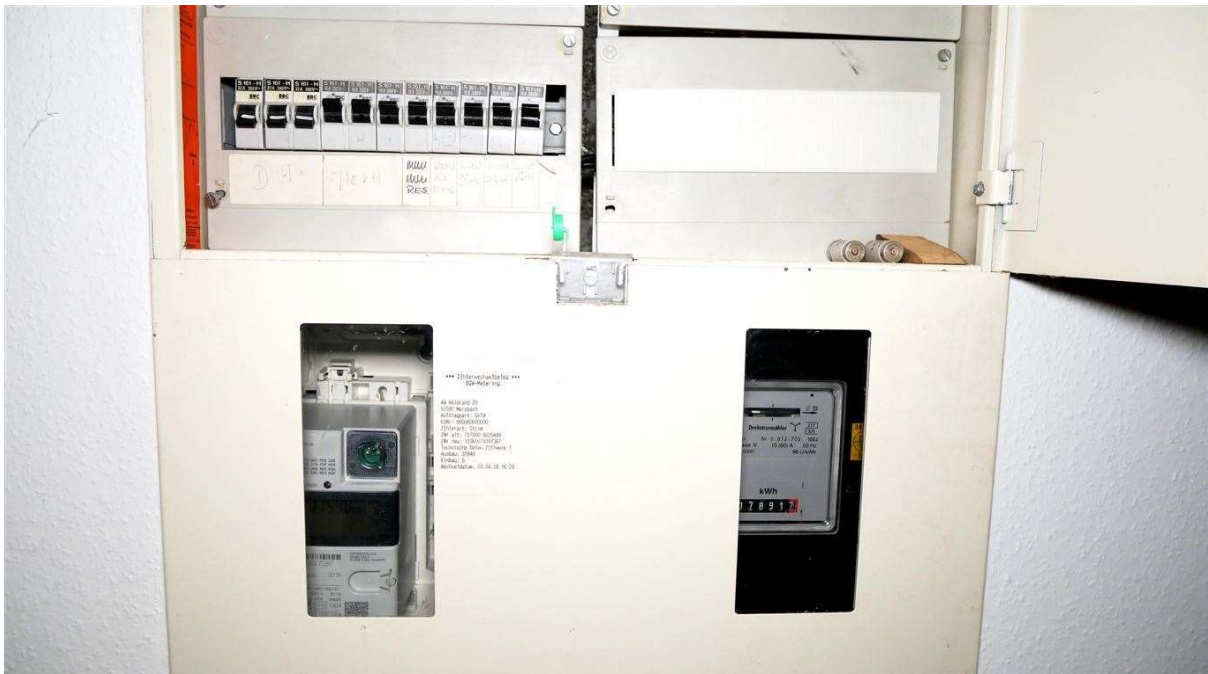
separate Strom- und Wasseleitungen