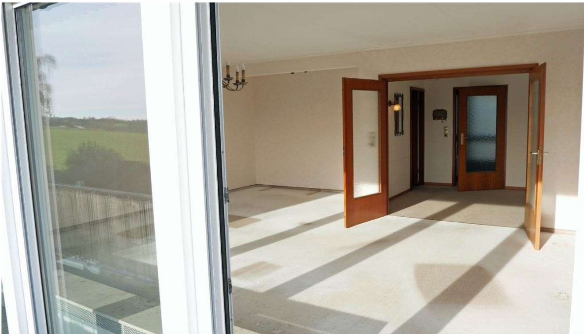
Blick in das 41 m 2 große Wohnzimmer mit...