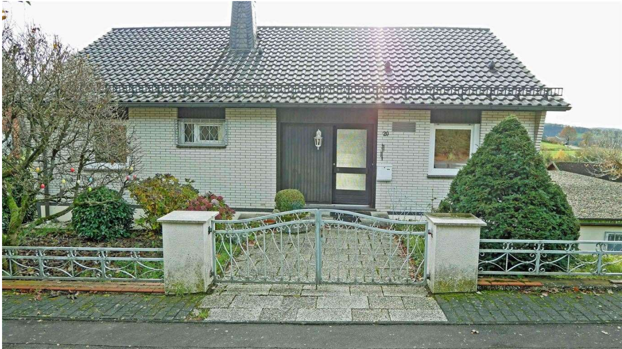
Straßenseite. Dach wurde ca. 2010 erneuert