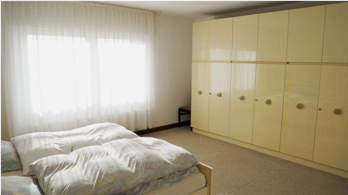
Insgesamt gibt es im Haus 4 Schlafzimmer