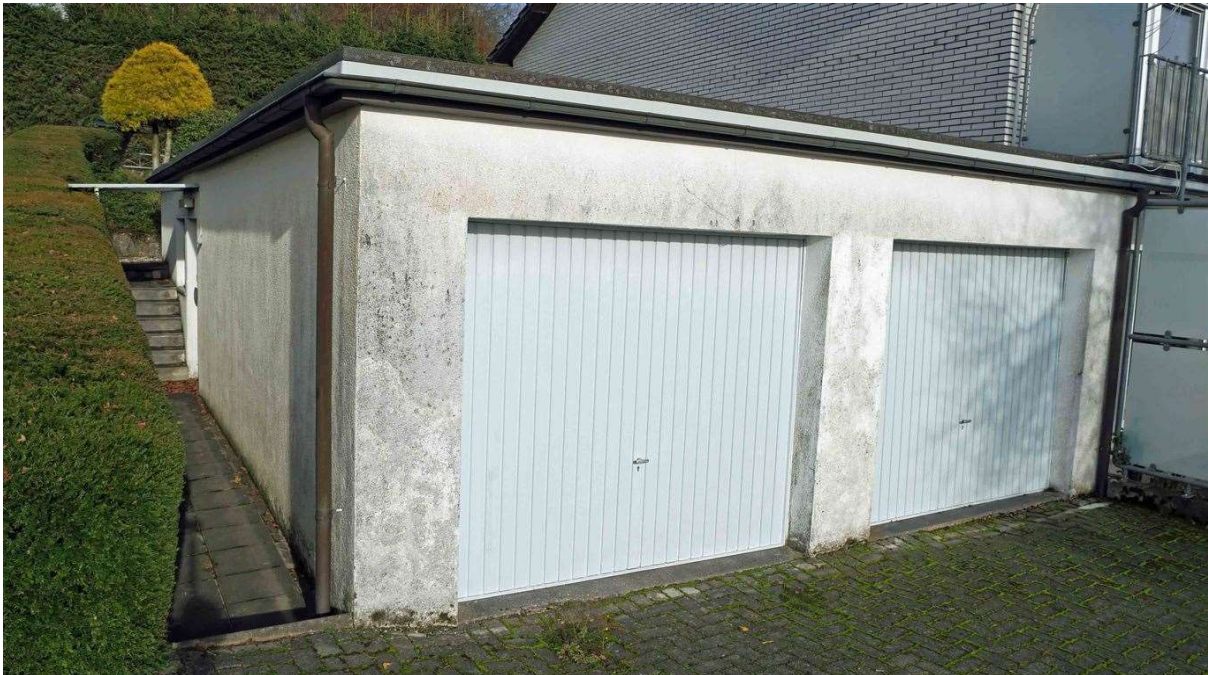
massive Doppelgarage. Hinten: sep. Eingang zur ELW