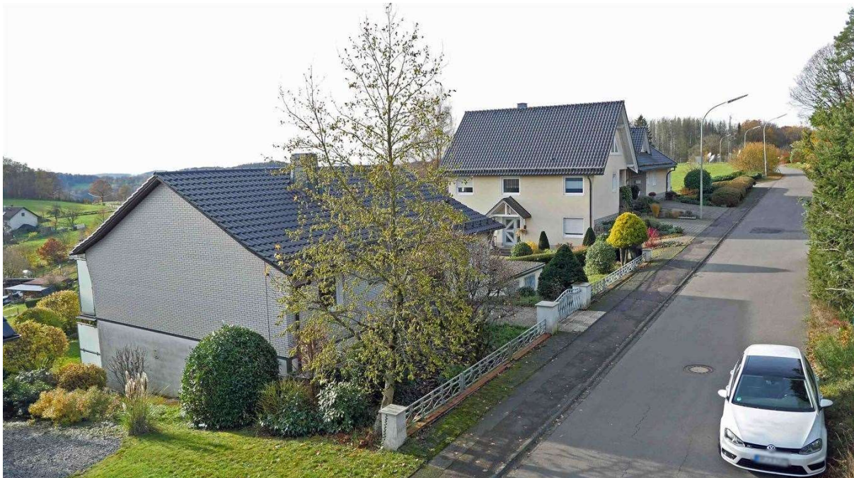
schöne, ruhige Wohnlage in der Natur