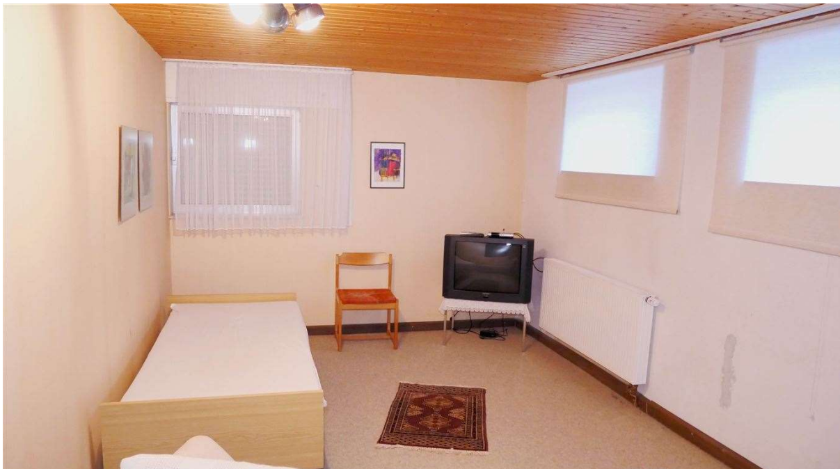
wohlich ausgebauter Keller