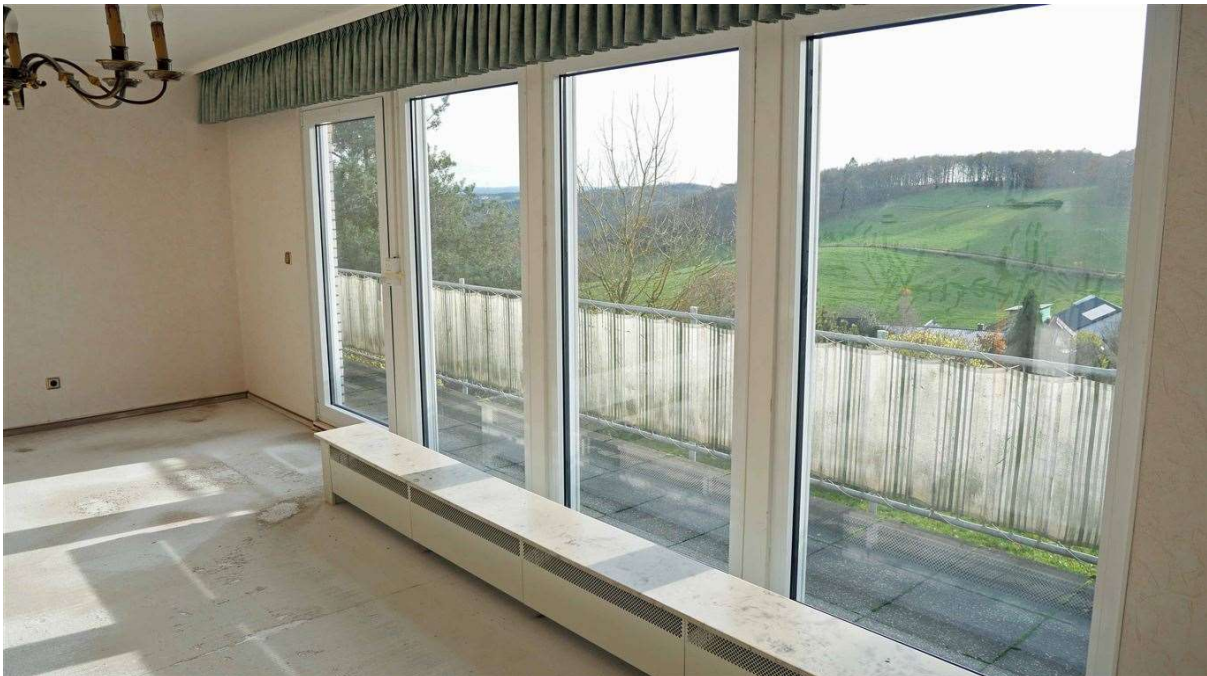
...Glasfront (Bj. 2022), Balkon und diesem Blick