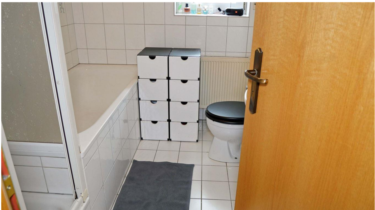
Bad/WC mit Dusche und Wanne