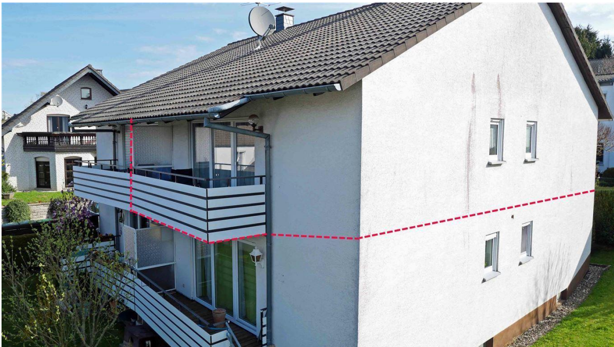
keine Nachbarn darüber aber Dachboden als Stauraum