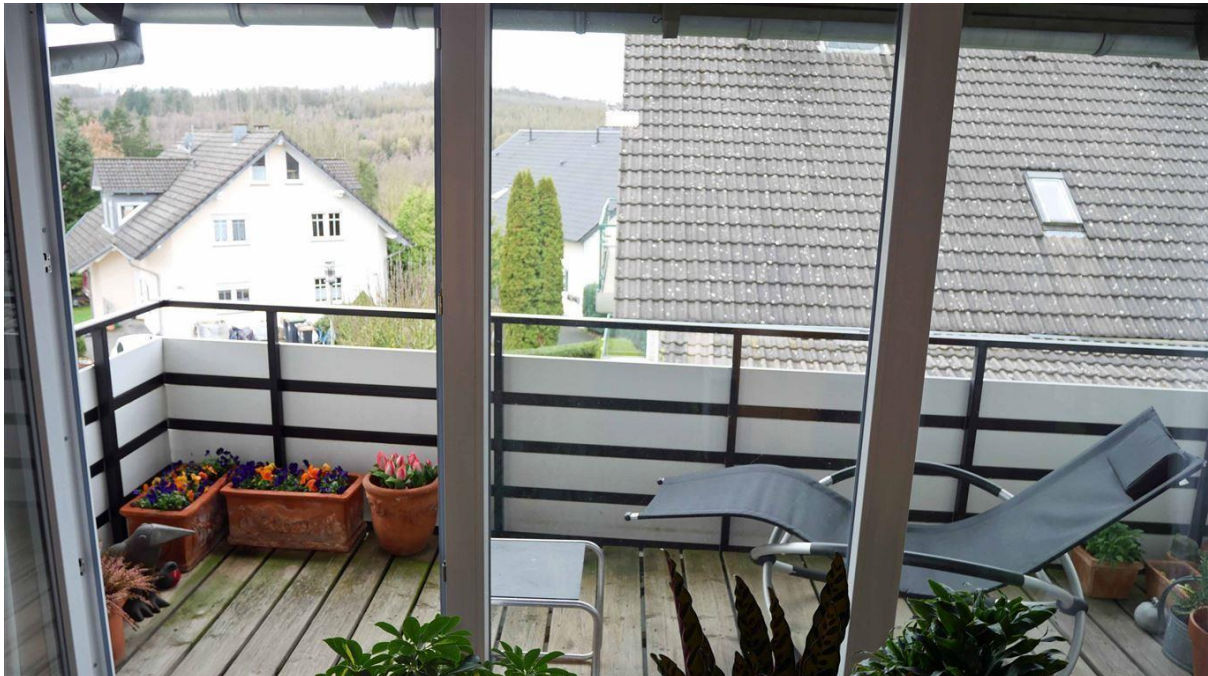
...Balkon mit Blick in die walddreiche Umgebung