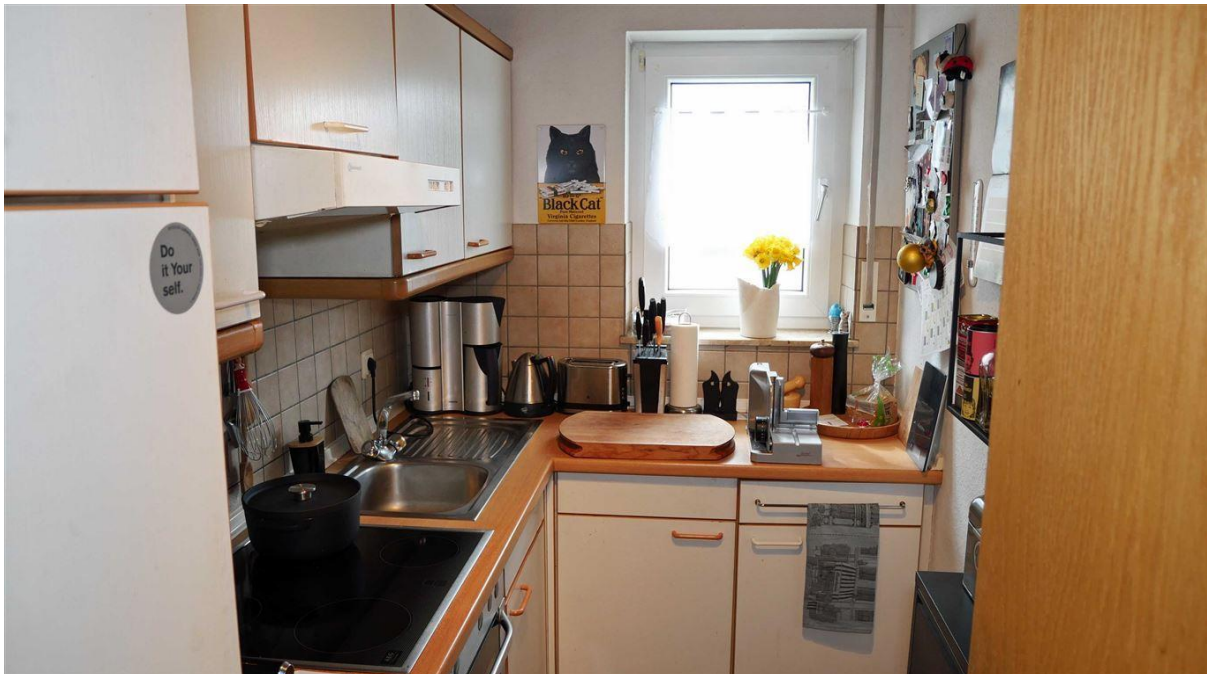
Küche (4,8 m 2 )