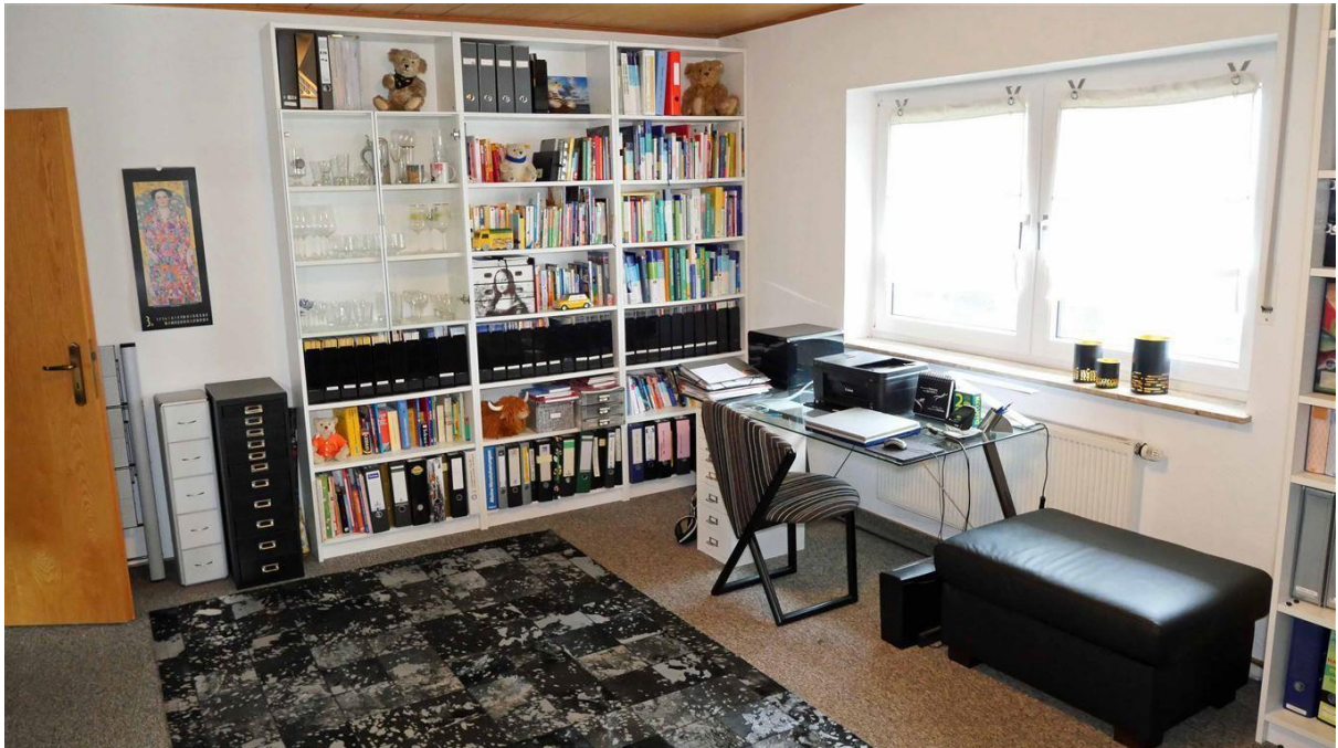
Schlaf-/Arbeitszimmer 19,49 m 2