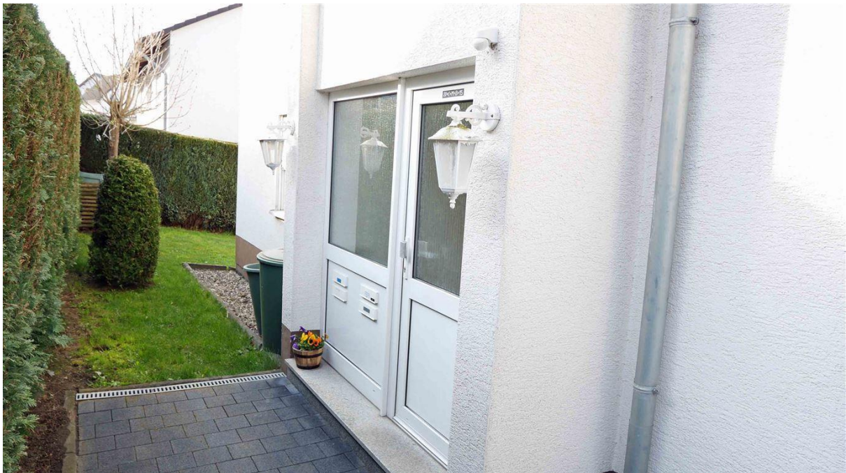
gepflegter Eingang an der Nordseite