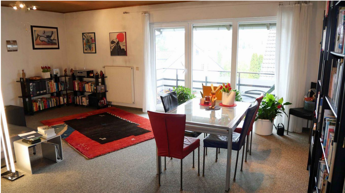
Wohn-/Esszimmer 32,45 m 2 mit...