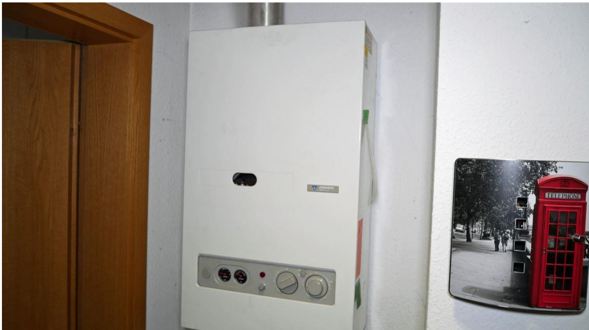
jede Wohnung verfügt über eine eigene Gasterme