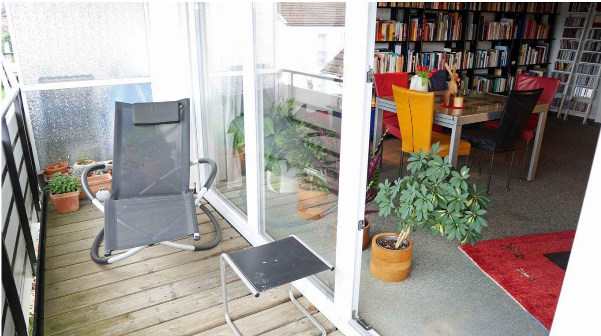
...Terrassentür zum Balkon (4,2 m 2 )