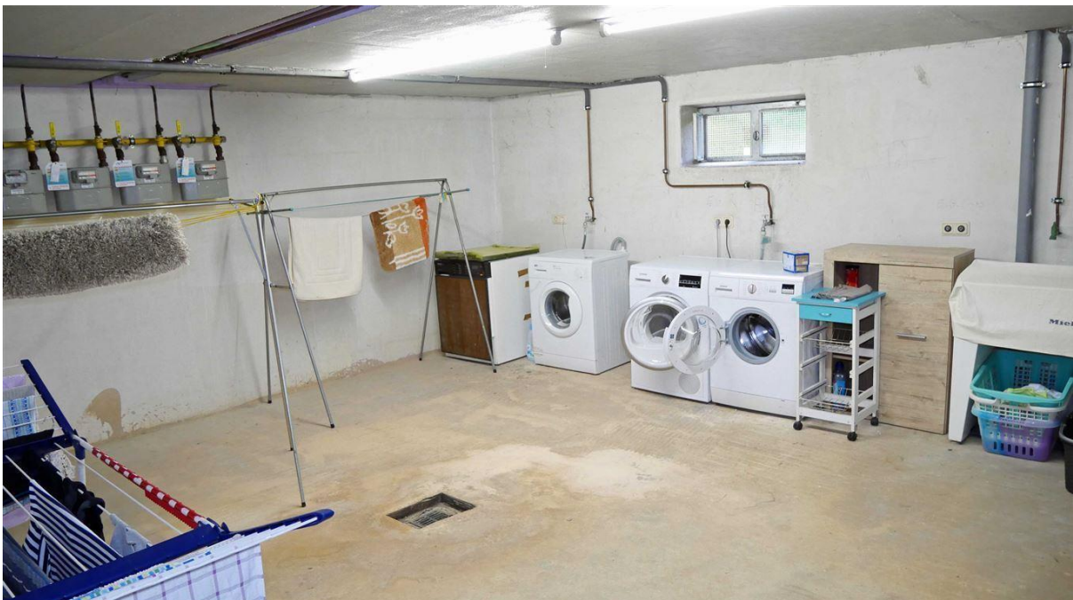
...großen gemeinschaftlichen Hauswirtschaftsraum