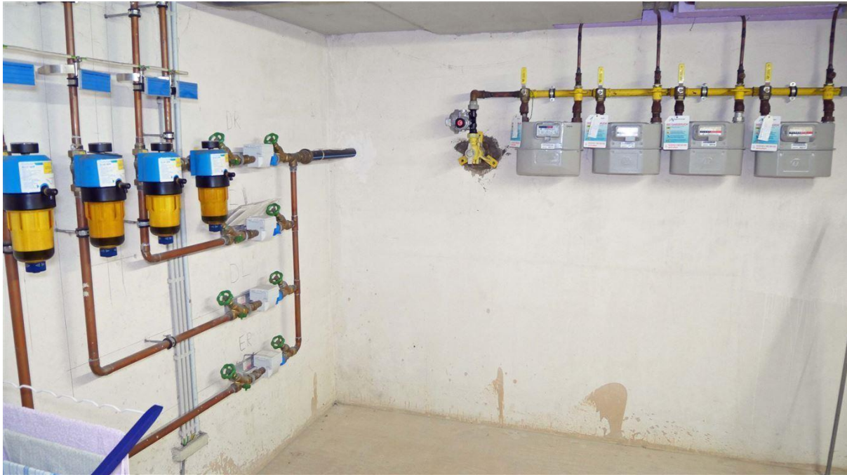
eigene Gas-/Wasser und Stromzähler im...