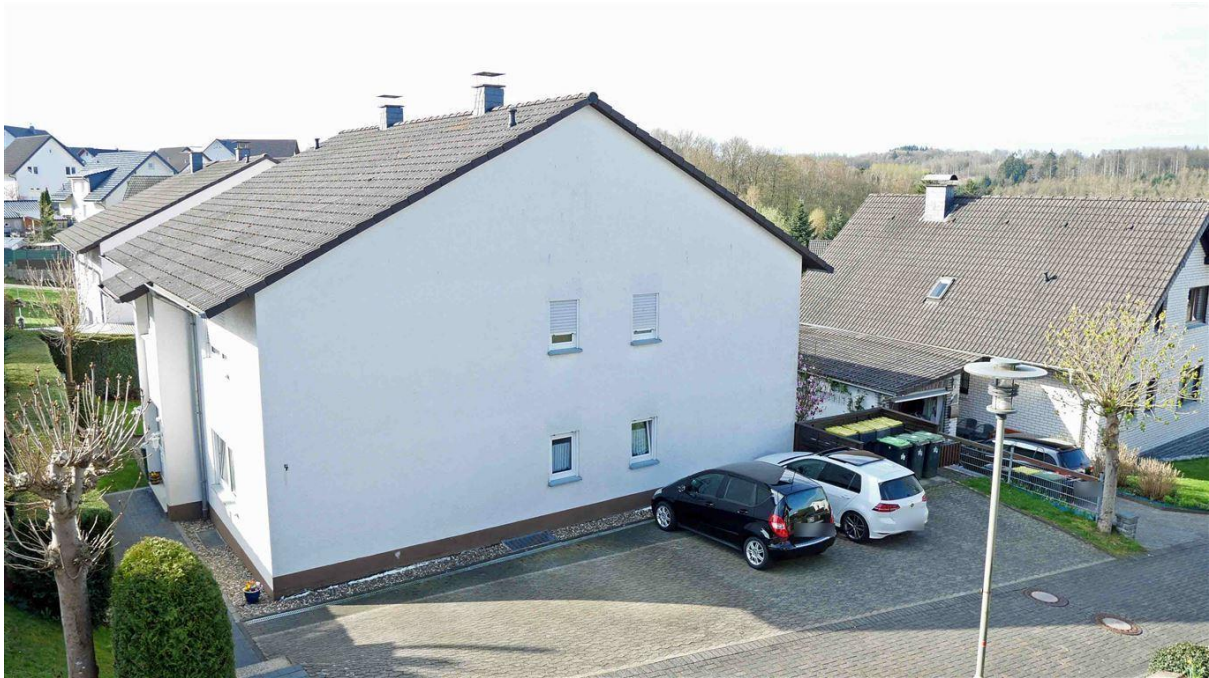
6 Parkplätze (2 für Gäste) direkt am Haus