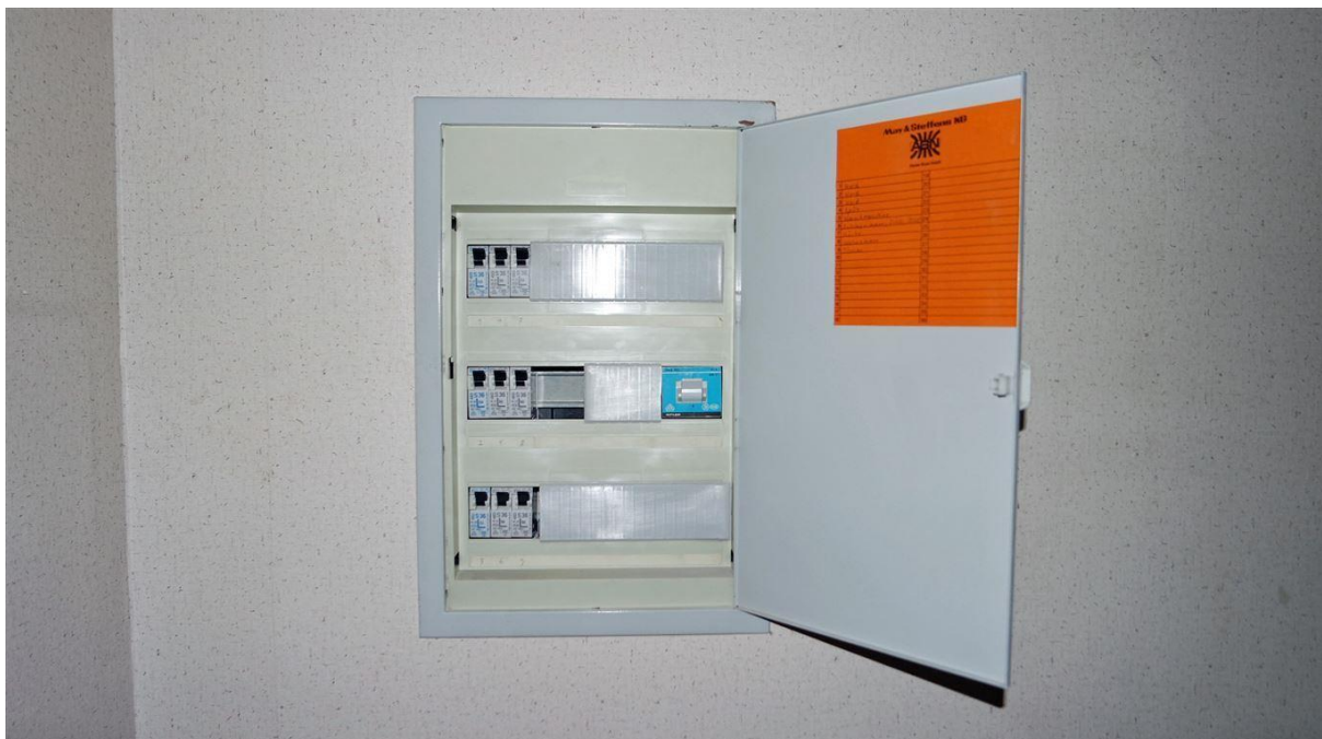
Sicherungskasten. Der Stromzähler ist im Keller