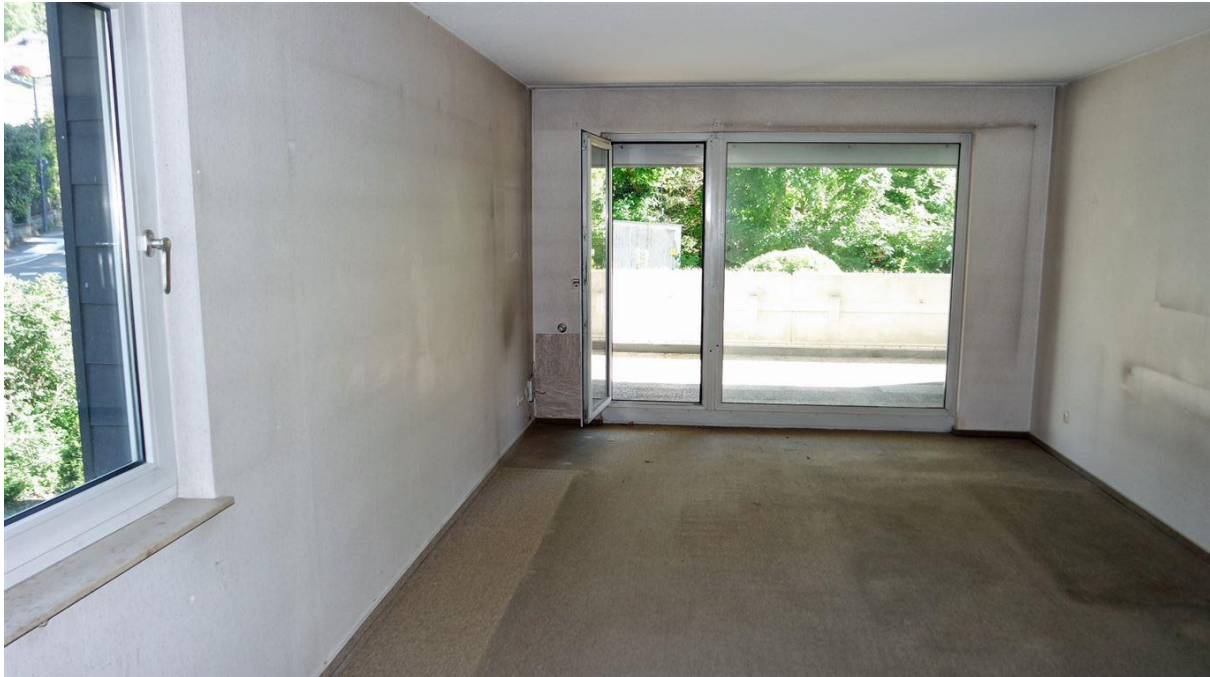
Blick in das 22,35 m 2 große Wohnzimmer mit...