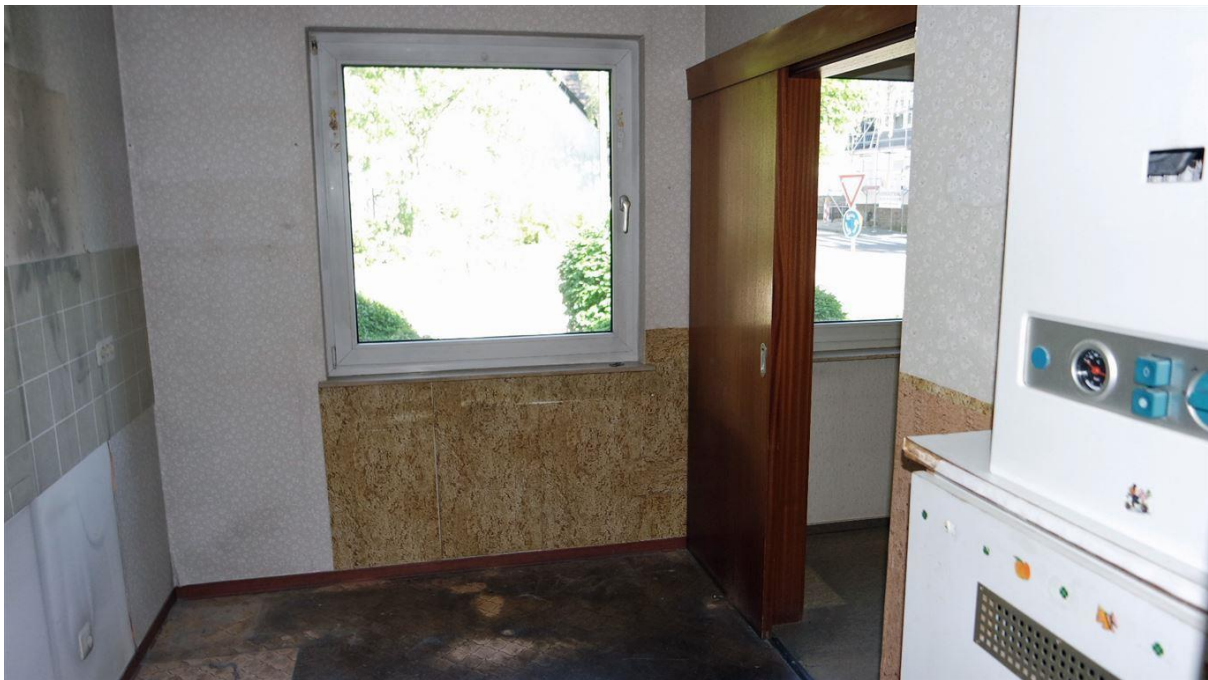
eigene Heiztherme/ Etagenheizung in der Küche