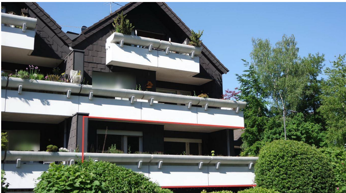
Balkon ist nicht einsehbar und ganz überdacht