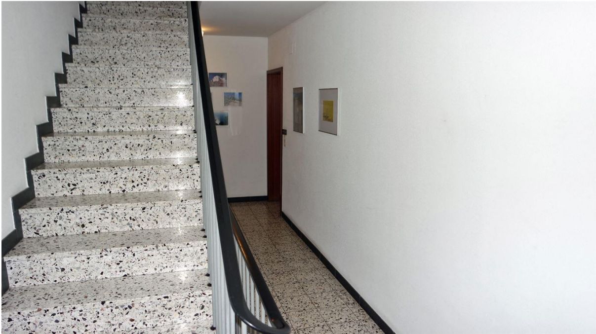
Blick in das gepflegte und freundliche Treppenhaus