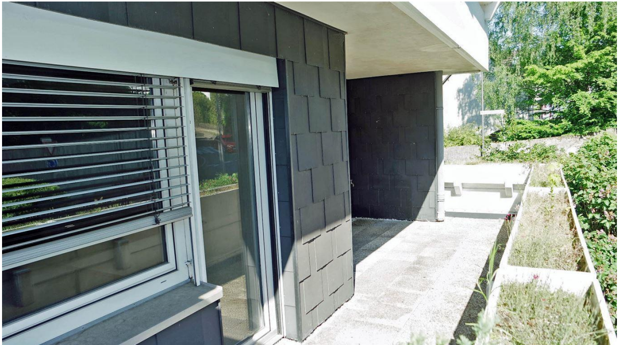
herrlicher 16,4 m 2 großer, überdachter Balkon