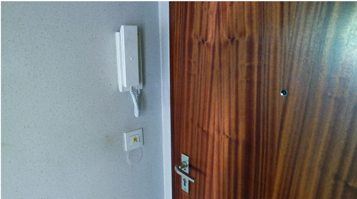
Wohnungseingang mit Türsprechanlage