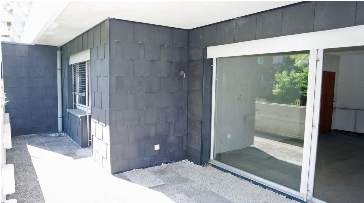
...Schiebetür zur Terrasse / Balkon