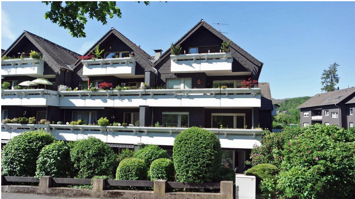
das Zentrum und der Bahnhof sind fußläufig zu erreichen