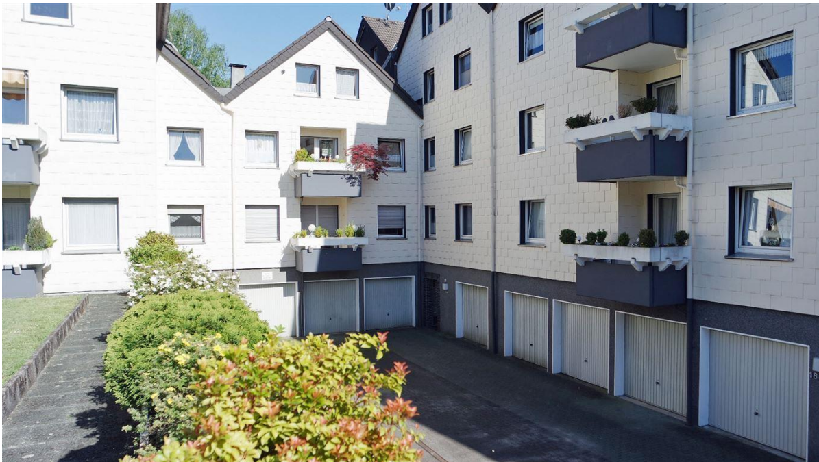
Innenhof mit Garagen (nicht im Kaufpreis enthalten)