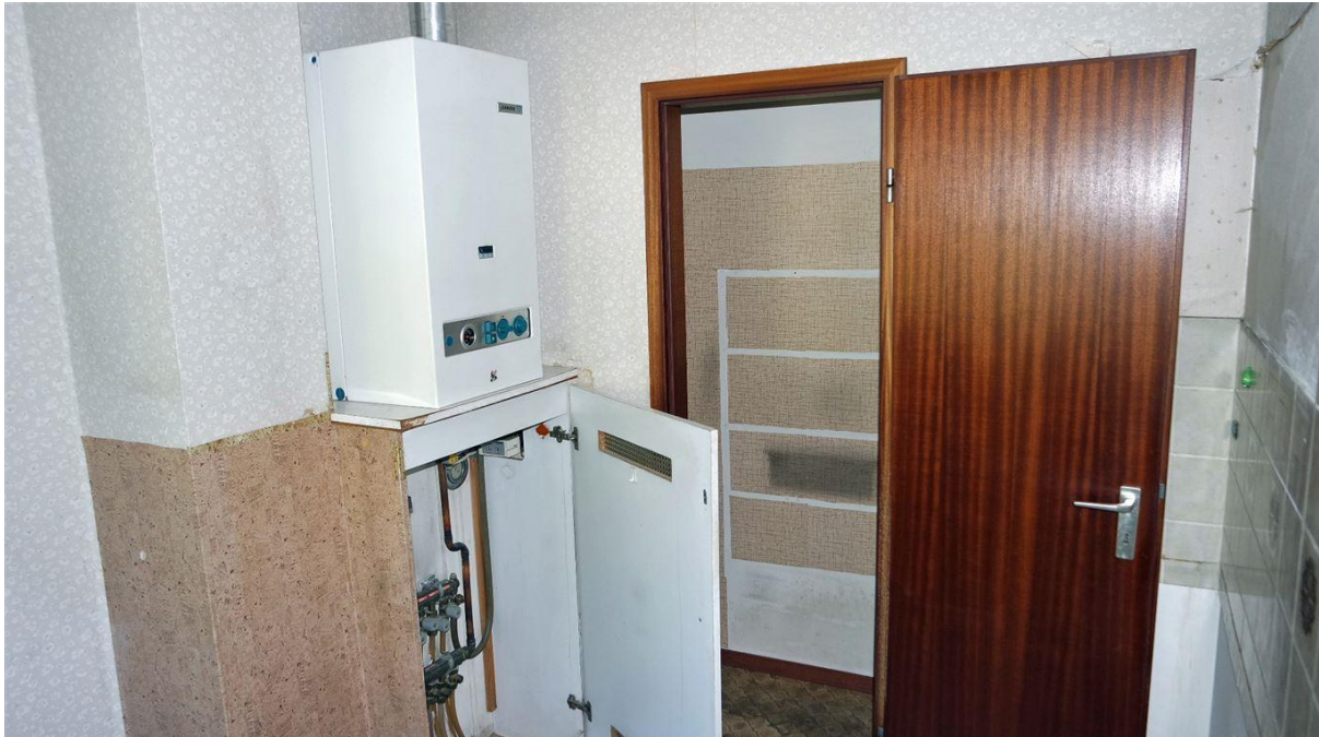
Junkers- Gastherme, Baujahr 19 84 (noch die Erste)...