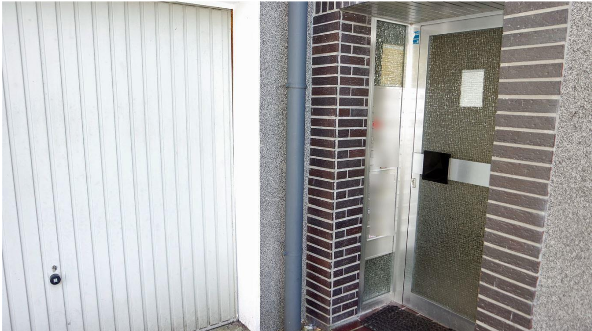
Hauseingang für jeweils 11 Wohnungen