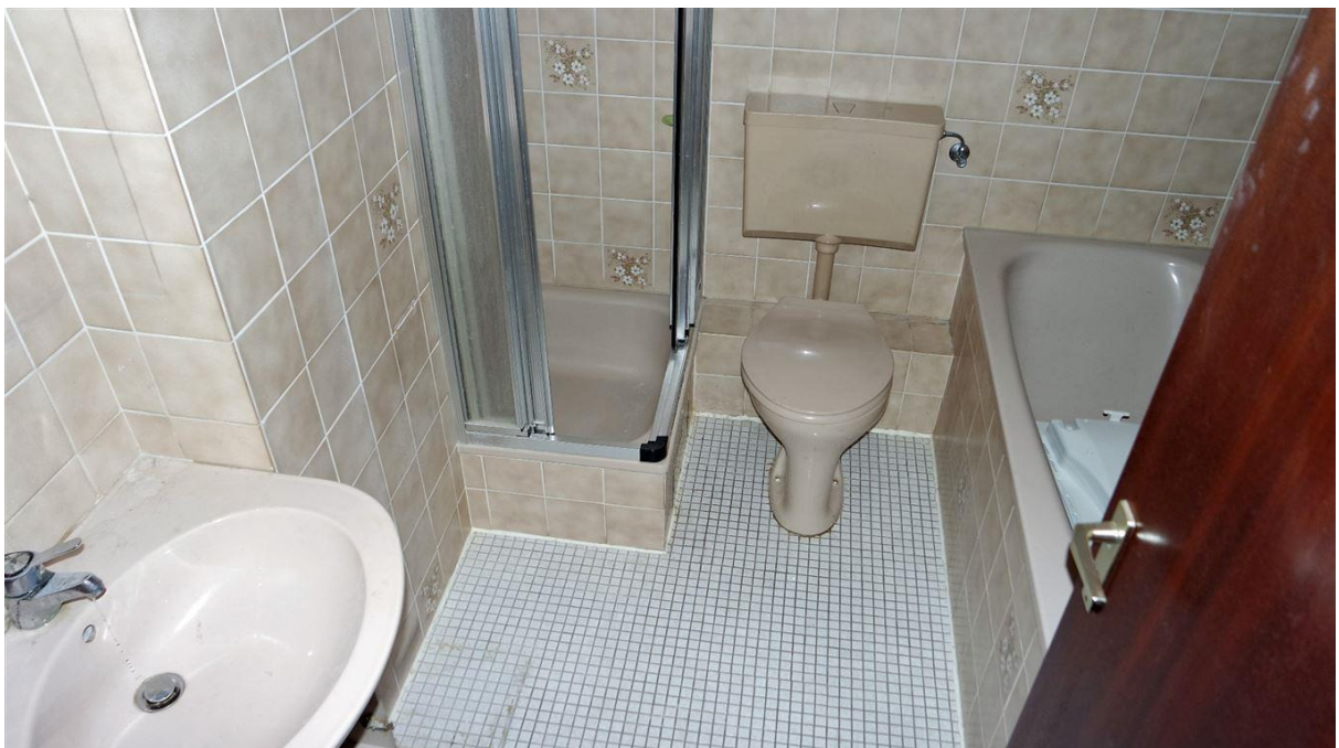
Waschmaschinenanschluss ist hinter der Tür