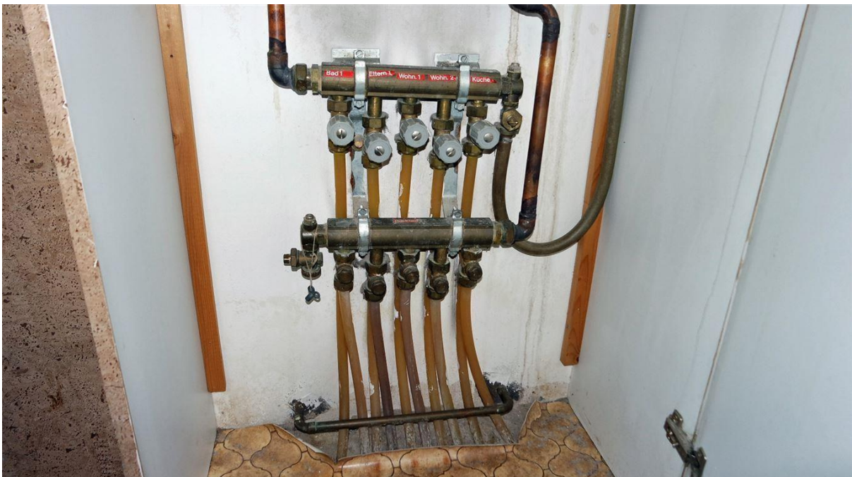
... Etagenheizung/überall als Fußbodenheizung