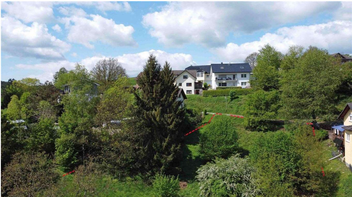
Hanglage. Am besten: Bebauung mit Keller