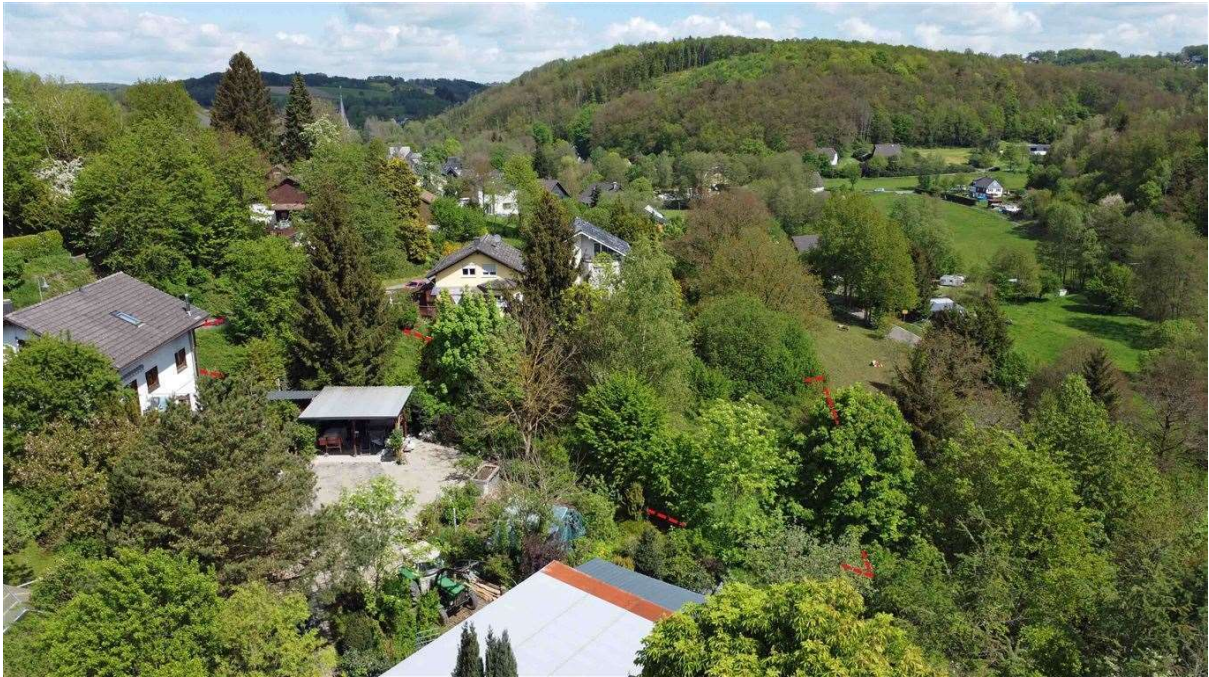
ca. 25 m breit und ca. 50 m tief