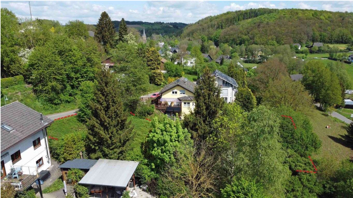
1.128 m 2 Baulücke