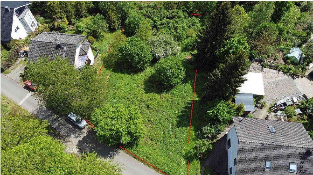
vollerschlossen und sofort bebaubar