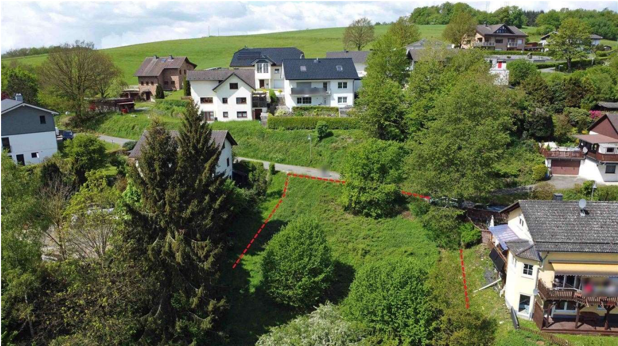
mögliche Bebauung: siehe Nachbarhaus